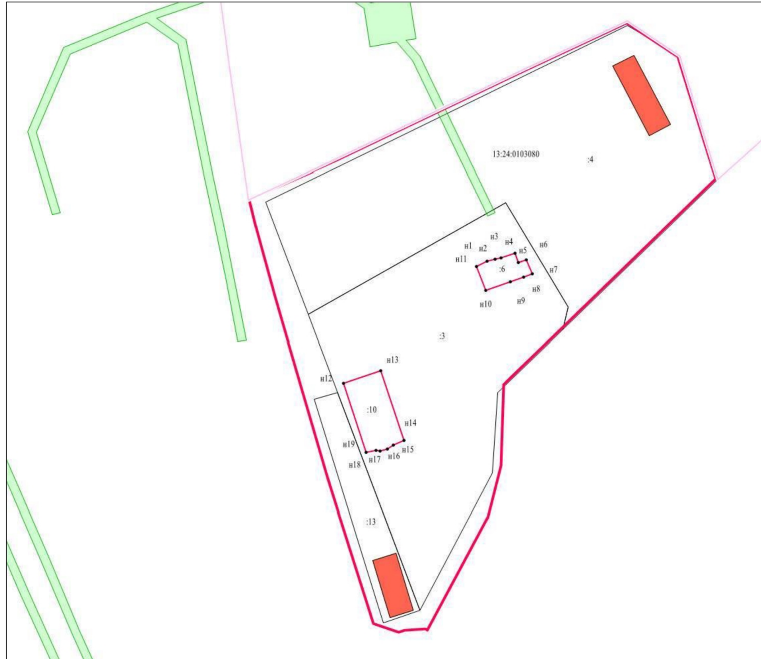
Масштаб 1:1 2000